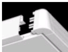
Connect Edge 500 Focus Ds - asennuksessa