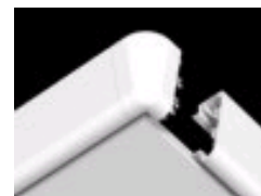
Connect Edge 500 Focus Dg - asennuksessa

AVATTAVUUS: Profiileja ei voida avata. Väli tilaan päästään akustiikkalevyjä irrottamalla.