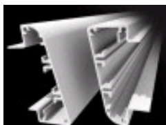
Ecophon Edge 500 -profiili