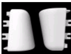
Ecophon Edge 500 -kulma